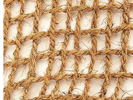
Kuva 6. Kookoskuituisen eroosiomaton asennus puukiinnikkein tekosaarien jyrkimpien ja romahtamisaltteimpien, paljaiden rinteiden osille (3.-4.5.2022). Oikealla lähikuva eroosiomattotuotteesta.