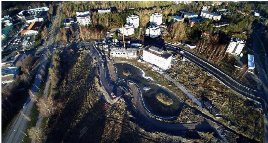
Kuvat 1 a. Papinpellon hulevesikosteikon suunnitelmakartta (Rauman kaupungin tekninen virasto. 14.8.2017.). 1 b. Papinpellon kosteikon rakenteet valmistuivat vuoden 2018 syksyllä (Länsi-Suomi 24.11.2018.).