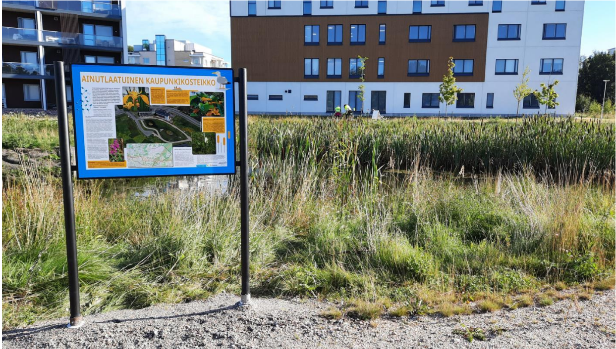
Kuva 8. Hankkeessa suunniteltu infotaulu esiteltiin kaupunkilaisille ‘Papinpellon hulevesikosteikko tutuksi’ – tapahtumapäivänä (30.8.2022).